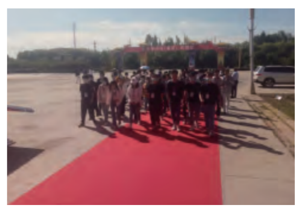
通讯员 百枣纲目 张崇华