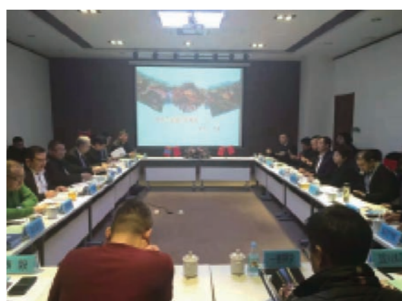
满了感恩，也充满了自豪。每个企业、每位企业家都应该牢记并领会民营企业座谈会精神，艰苦奋斗、敢闯敢干、聚焦实业、做精主业，增强创新能力和核心竞争力，为社会的发展做出民营企业家的积极贡献！