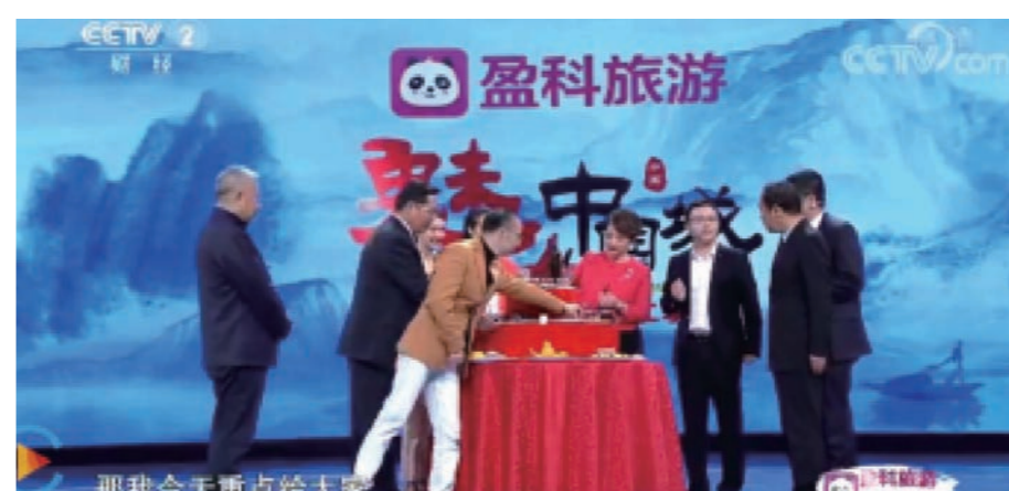
央视舞台、星光璀璨、流光溢彩，枣乡乐陵携悠久厚重的历史，热情淳朴的民风、源远流长的民间艺术，感人至深的革命故事在这里精彩绽放。11月25日，备受瞩目的