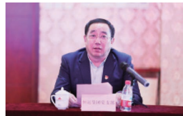
事”“2018年党建特色经验做法”“2019年工作计划及对党委的建议期许”等三个方面进行了分享和讲述。