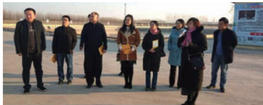
通讯员 清洋湖 孙莹

湖在养殖过程中取得的成绩和遇到的困难，并指出乡村振兴是打赢精准扶贫攻坚战的根本决策，实现产业联动，推动农民致富增收，保证农民高质量脱贫，好的项目就要推广，从而推动乡村振兴战略有效实施。